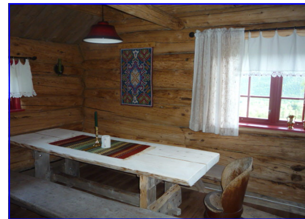
Inne i sovehytta...