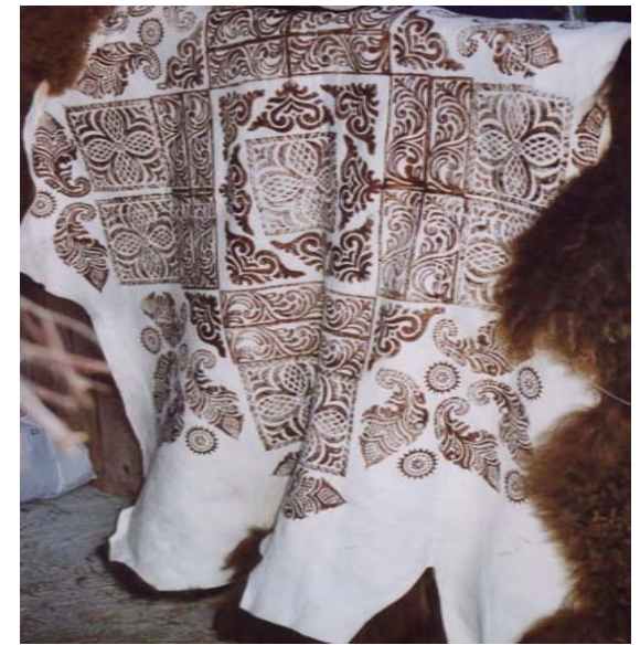
Eit slumreteppe i sofaen ein kald vinterkveld! Denne er laga av fire langhåra spelsauskinn. Kanten er "ubehandla." Trykka er frå Tuddal og Hjartdal.