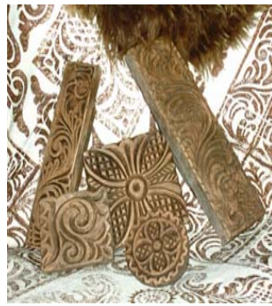
Stempla er skore ut i tre. Er det først trykt er det ingen veg tilbake. Dette er gamle stempel frå Tuddal.