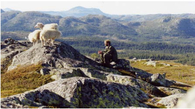
Frå sauesankinga i Hjartdalsfjella med Vindeggen i bakgrunnen.