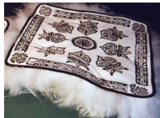
Sitteunderlag m. trykk.