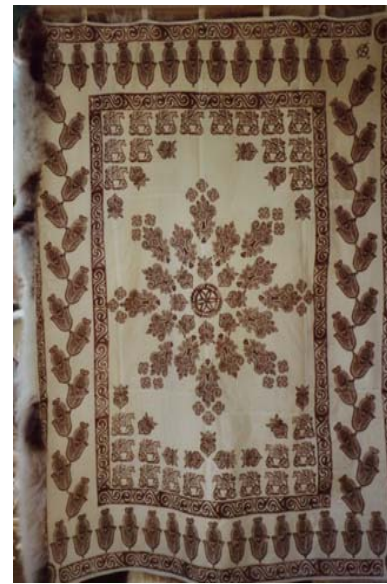
Tolv-skinnsfell av villsau til dobbeltseng.