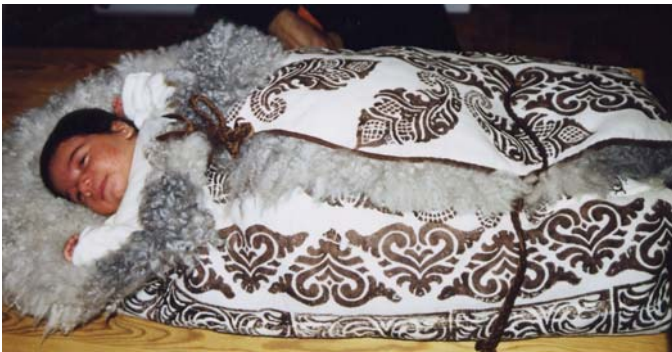
Ein babyteppepose av pelssau som veks med ungen. Du kan brette posen ut som eit teppe til babyen og sidan legge han i godstolen.